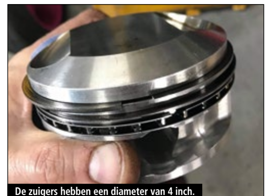
De zuigers hebben een diameter van 4 inch.