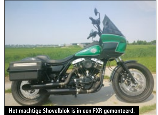
Het machtige Shovelblok is in een FXR gemonteerd.